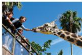
野生を感じる、自然からの 熱いメッセージに耳を傾ける、ひととき