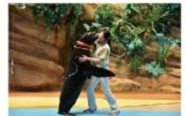
遠い昔から一緒だった 海からのやさしい贈り物に会う