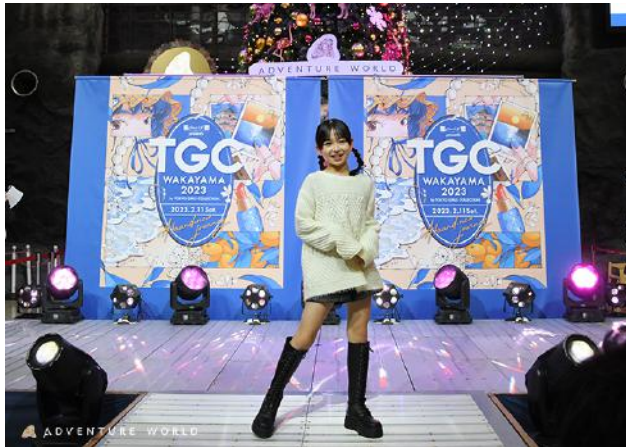
昨年開催 2次審査 公開オーディションの様子