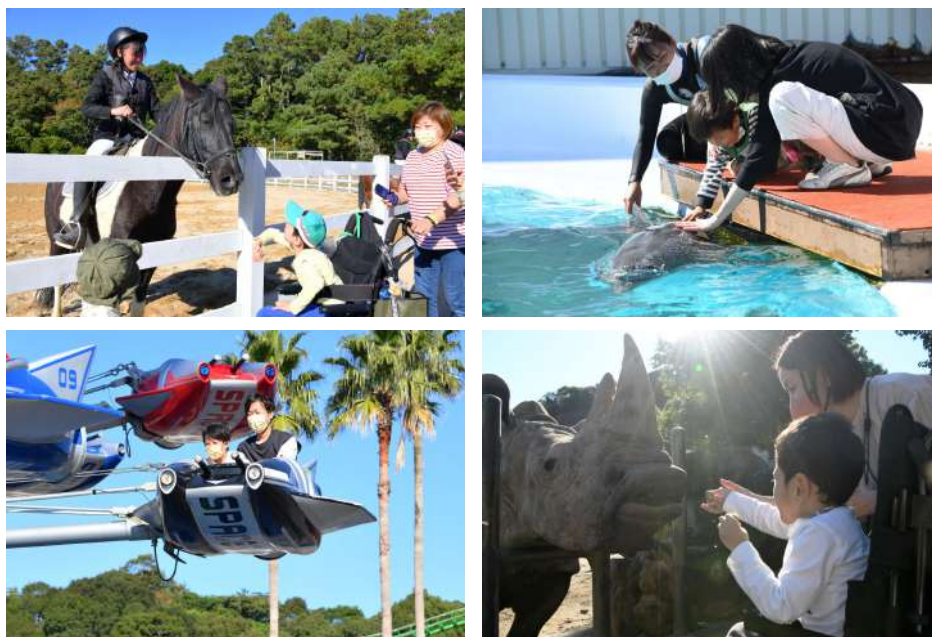
2022年11月3日開催の様子

「ドリムデイ・アット・ザ・ズー（主催：和歌山ドリムデイ2023実行委員会）」を2023年11月23日（木・祝）アドベンチャーワールド（和歌山県白浜町）で開催いたします。障がいのあるお子さまとご家族を貸切のパークへ招待する本イベントは、2017年から開催し、今年で6回目となります。