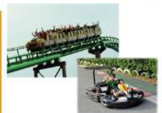
型にこだわらない遊びがまっている