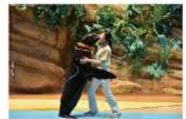
遠い昔から一緒だった 海からのやさしい贈り物に出会う