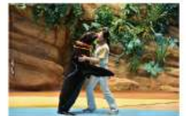
遠い昔から一緒だった 海からのやさしい贈り物に出会う