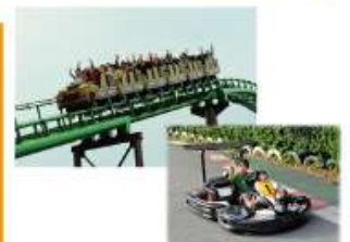
型にこだわらない遊びがまっている