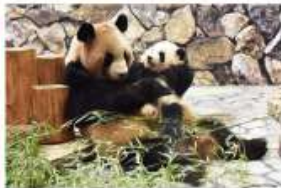
新たな出会いと感動の空間 パンダファミリーに感動の大接近