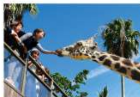
野生を感じる、自然からの 熱いメッセージに目を傾ける、ひととき