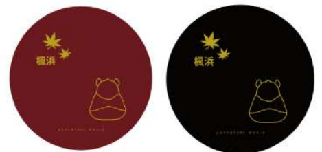
丸盆デザインイメージ

体験内容について詳しくはこちら http://www.chuokai-wakayama.or.jp/sikki-k/02_taiken.html