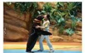
遠い昔から一緒だった 海からのやさしい贈り物に出会う