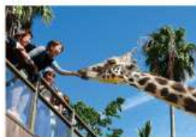
野生を感じる、自然からの 熱いメッセージに目を傾ける、ひととき