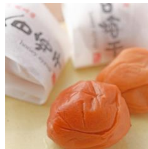
▲紀州南高梅 天日梅干

和歌山県推奨の優良産品プレミア和歌山と紀ノ川SA上り線を運営する水と軒とのコラボレーションにて、プレミア和歌山商品の中から更にSAご利用のお客様にお勧めしたい商品を取り揃えた「特10コーナー」や、南紀勝浦から直送の海鮮丼をお楽しみいただけます。