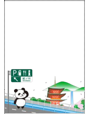
紀ノ川 (SA) 下り線