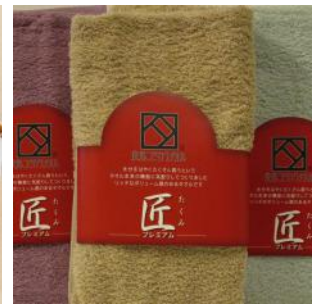
▲泉州こだわりタオル