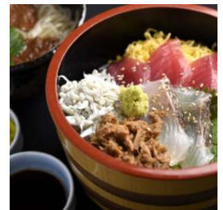
▲紀ノ川 海の恵み丼