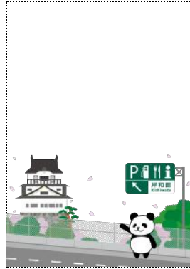
岸和田 (SA) 上り線