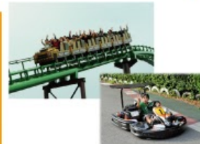
型にこだわらない遊びがまっている