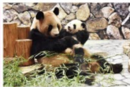
新たな出会いと感動の空間 パンダファミリーに感動の大接近