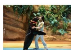
遠い昔から一緒だった 海からのやさしい贈り物に出会う