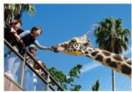
野生を感じる、自然からの 熱いメッセージに耳を傾ける、ひととき