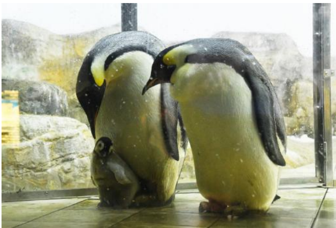
10月2日生まれの赤ちゃんとお親鳥 11月13日撮影