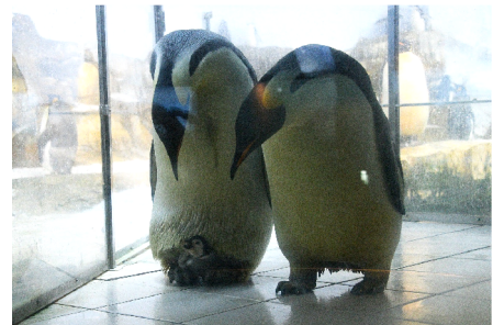
親子で過ごす様子