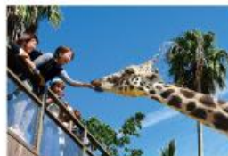
野生を感じる、自然からの 熱いメッセージに耳を傾ける、ひととき