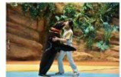
遠い昔から一緒だった 海からのやさしい贈り物に出会う