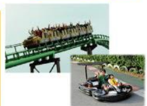
型にこだわらない遊びがまっている