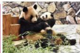
新たな出会いと感動の空間 パンダファミリーに感動の大接近