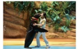
速い昔から一緒だった 海からのやさしい贈り物に出会う