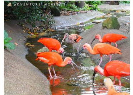
ショウジョウトキ

アドベンチャーワールド（和歌山県白浜町）は、2020年5月20日（水）より、みさき公園（大阪府泉南郡岬町）からの動物受け入れを開始しました。7月15日（水）には、アミメキリン1頭を搬入し、現在までに 28種 約170頭が仲間入り しましたので、ご報告いたします。