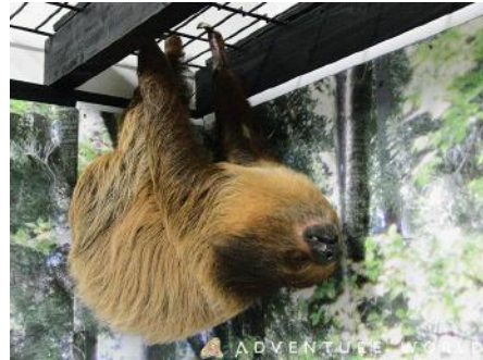
フタユビナマケモノ