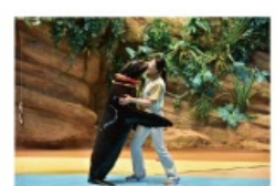
遠い昔から一緒だった 海からのやさしい贈り物に出会う