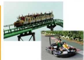
型にこだわらない遊びがまっている