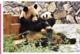
新たな出会いと感動の空間 パンダファミリーに感動の大接近