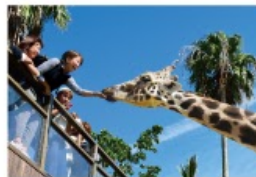
野生を感じる、自然からの 熱いメッセージに耳を傾ける、ひととき