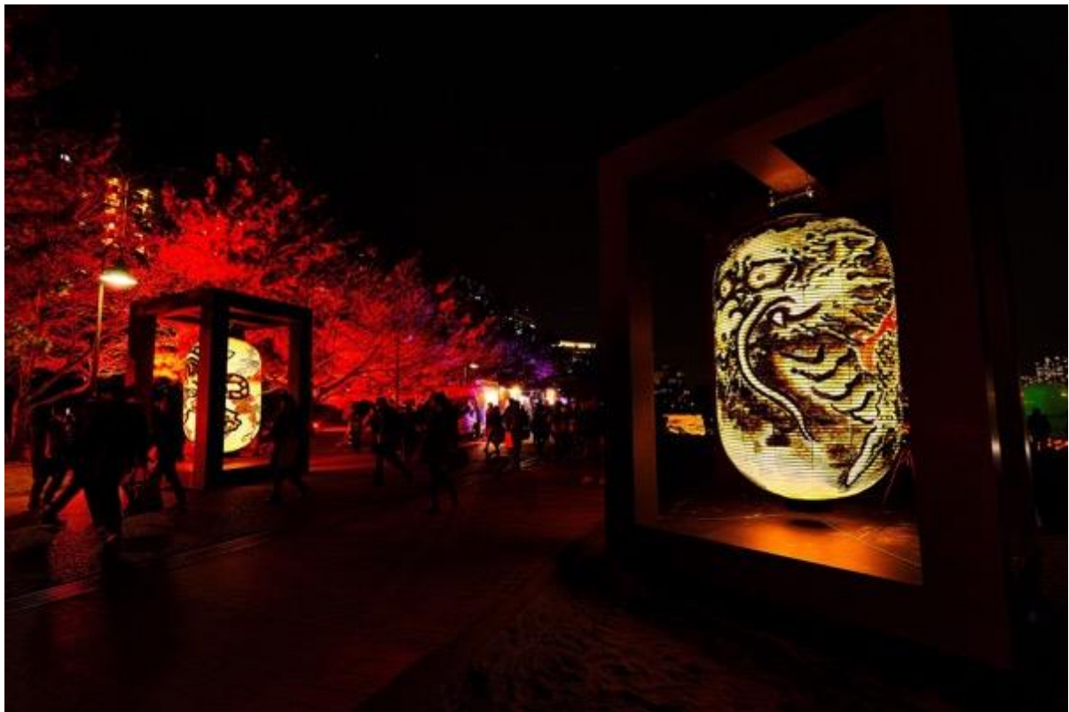
国芳・写楽巨大提灯<写真は過去株式会社SECAIで制作した巨大提灯でイメージです>

会場に入ると、日本の伝統的な照明である灯籠が街の入り口を彩り、来場者をお出迎え。この灯籠は、大田区内の中学校が一部制作協力してもらった”浮世絵の動物”や“大田区ゆかりの浮世絵”が描かれた置型の