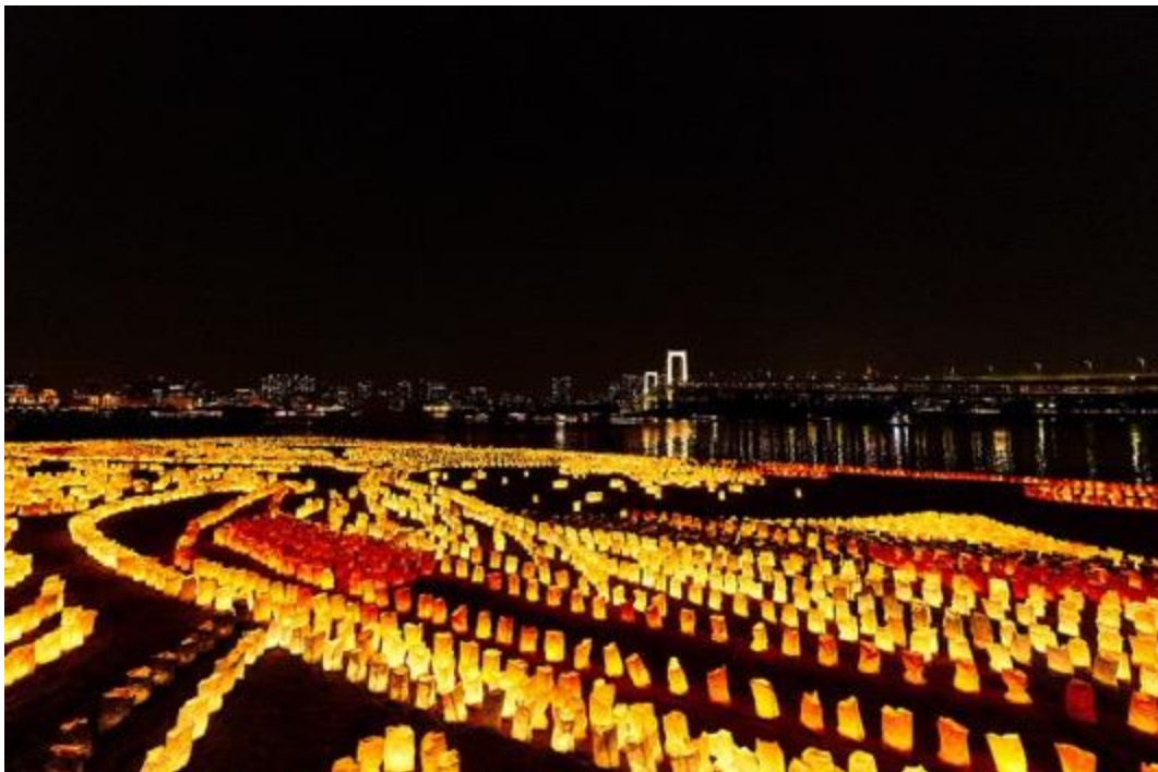
巨大浮世絵「羽田旋風快晴」

代表作に真言宗善通寺派大本山隨心院の襖絵、臨済宗建仁寺派大本山建仁寺塔頭六道珍皇寺の屏風、全国各地の祭りの絵など多岐にわたり、フランスやベトナムでも作品発表をおこなっている。