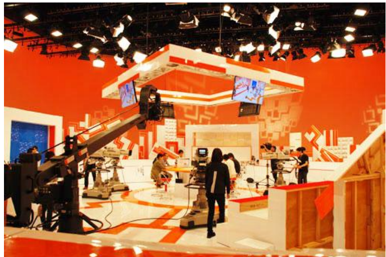
スタジオ WBS収録準備