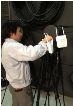
アクセスポイント準備