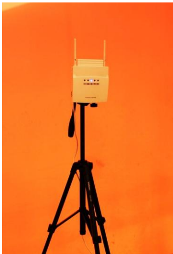
アクセスポイント スタジオ設置

今後も、多くのイベントで採用され、利便性の向上に貢献できるものと期待しています。