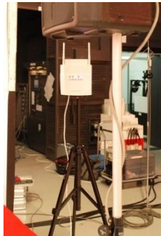
アクセスポイント設置