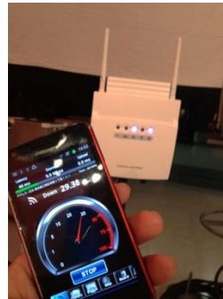
スタジオ内 通信速度