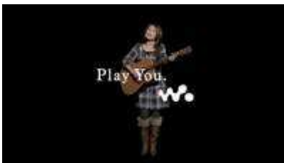
《YUI》 音探しの旅のテーマ : 「場所」と「音」 新楽曲タイトル : Your Heaven

12月12日(日)18:00より放送のTBS系列「THE 世界遺産」で60秒の限定CMを放映致します。 CMでは「キミの知らない音 project」を通して、YUI、清水翔太、JASMINEが制作した新楽曲を初披露致します。YUIは「場所」と「音」をテーマに自分がよく聴いている音楽に関係が深い場所に。清水翔太は「出会い」と「音」をテーマにNYのピアニスト達のもとへ。そしてJASMINEは「言葉」と「音」をテーマに、自分の内面を巡る旅をしてきました。そこで感じたコトや出会った音等の様々なインスピレーションを、楽曲に表現しております。暗闇の中で、彼らの息遣いも聞こえるような、臨場感あふれるCMとなっております。