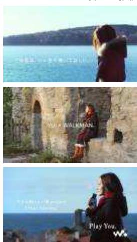
《「キミの知らない音 project」 Your Heaven 篇 15秒》