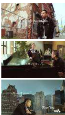
《「キミの知らない音 project」 YOU&I 篇 15秒》