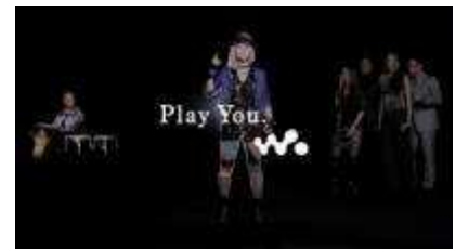
《JASMINE》 音探しの旅のテーマ : 「言葉」と「音」 新楽曲タイトル : ONE