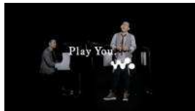
《清水翔太》 音探しの旅のテーマ : 「出会い」と「音」 新楽曲タイトル : YOU&I