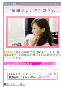
“横顔ジェンヌ”コラム