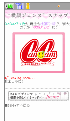
“横顔ジェンヌ”スナップ

街の女の子をモデルに、誰でも今すぐまねできる簡単な横顔アレンジを紹介。CanCamヘア・メイクが一人ひとりに合ったJienneとヘア・メイクやアクセサリ等をスタイリングし、女の子を“横顔ジェンヌ”に変身させます。 ※8月9日(月)コンテンツアップ予定