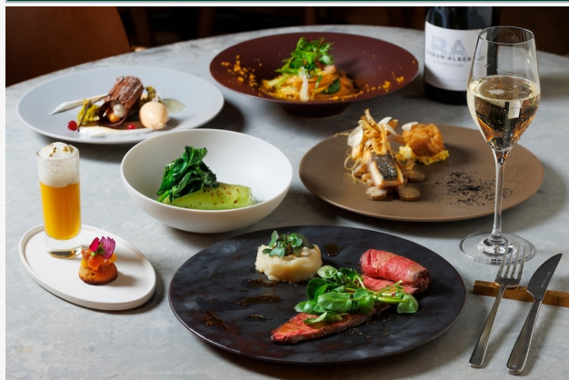
※クリスマスコース

京都〈ERUTAN RESTAURANT/BAR〉で、旬を味わうとおきの「デザートコース」がスタート。 ホリデーシーズンに合わせて、3日間限定の「クリスマスコース」の予約も開始いたします。