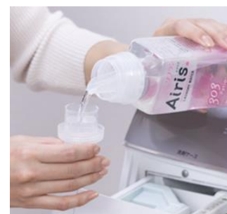
『ソフラン エアリス』の透明な液剤