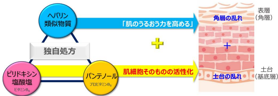
図1 各成分の肌へのアプローチ

肌みずからがうるおう力を再生する「ヘパリン類似物質」に加え、肌細胞を活性化するWビタミン「パンテノール（プロビタミンB 5 ）」「ピリドキシン塩酸塩（ビタミンB 6 ）」を配合しています（図1）。