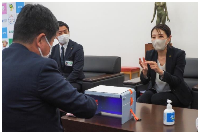
▲市長への「清潔衛生レクチャー」