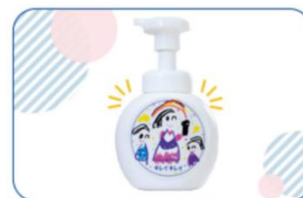
図3 マイボトルのできあがりの様子