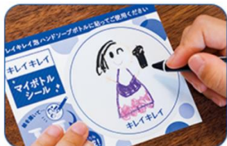
図1 シールにお絵描き