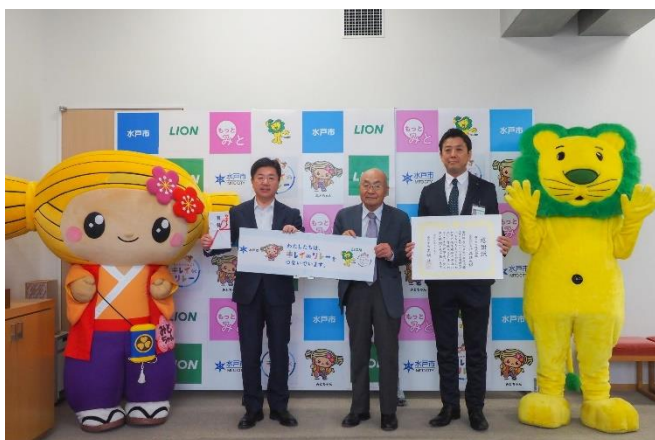
▲取組みキックオフ式当日の様子

『キレイキレイ』ブランドは今後継続的に、本プロジェクトを通じて、趣旨にご賛同いただいた全国の事業者をはじめとした皆さまと共に、人々が笑顔で触れ合える豊かな暮らしを守り、もっと前向きに過ごせる社会の実現に向けて活動してまいります。