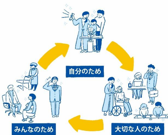
▲『キレイのリレー』概念図

「『キレイのリレー』プロジェクト」は、様々な事業者との協働により“大切な誰かを想い、清潔衛生行動をとることが、自分の生活を支える誰かの笑顔を生み出していく”という考えを伝えるために、本プロジェクトの趣旨にご賛同頂いた事業者の方々と一緒になって、人と人との触れ合いにあふれ、人と寄り添いながら、もっと前向きに過ごせる社会を目指していくプロジェクトです。