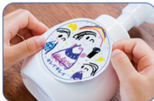
図2 『キレイキレイ薬用泡ハンドソープ』の本体ボトルの表側にシール貼付