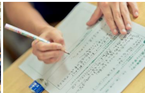
▲衛生習慣教室での様子（イメージ）