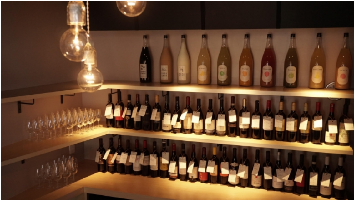
※画像は赤坂店です