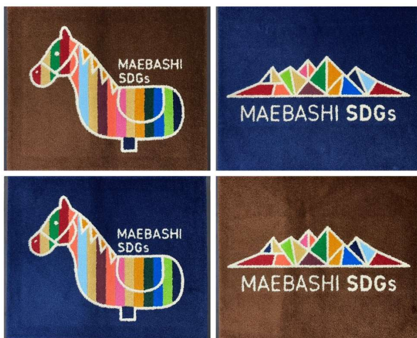
サニクリーン前橋 SDGs ロゴマット

調達する食料は SDGs ロゴマットをご使用頂くお客様（食品を扱っている会社・店舗）から購入し、お客様・フードバンクまえばし利用者・サニクリーン前橋の三者が笑顔になれることを目指すとともに、地域の子どもたちの貧困問題解決へと貢献します。