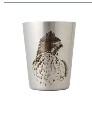
協力：藪内正幸美術館

①サントリー特別賞：観察対象種（水鳥 3 種：ヒドリガモ、マガモ、オオバン）をすべて見た方 10 人（該当者多数の場合は抽選）に、サントリーホールディングス株式会社提供の「ステンレス製真空タンブラー『クマタカ』（藪内正幸イラスト）」をさしあげます。