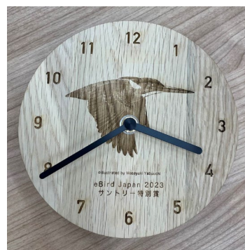
サントリーホールディングス（株）提供 「育林材の時計（カワセミ）」 直径約16cm

●育林材について https://www.suntory.co.jp/eco/forest/ikurinzai/