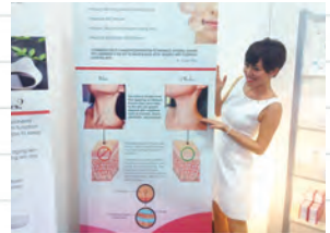
美容展示会コスモプロフ@ラスベガス

私はもともと肌に悩みを抱えていたので、スキンケアには人一倍敏感。 たくさんの女性の悩みに接してきた中で、いつか肌の悩みを抱えた人をサポートしたいと思っていました。 そんな時です。世界初となる、醸造発酵物から抽出できる天然のヒト型セラミドとの出会いがあったのは、 国際美容展示会コスモプロフ@ラスベガスに 『脂質研究所』の出展をサポートさせていただいたこと。 「これだ!」と思えたのが天然ヒト型セラミドです。 半信半疑で使用するうちに、私の肌はみるみる潤い、ツヤやかになり 健やかな肌になっていったのです。