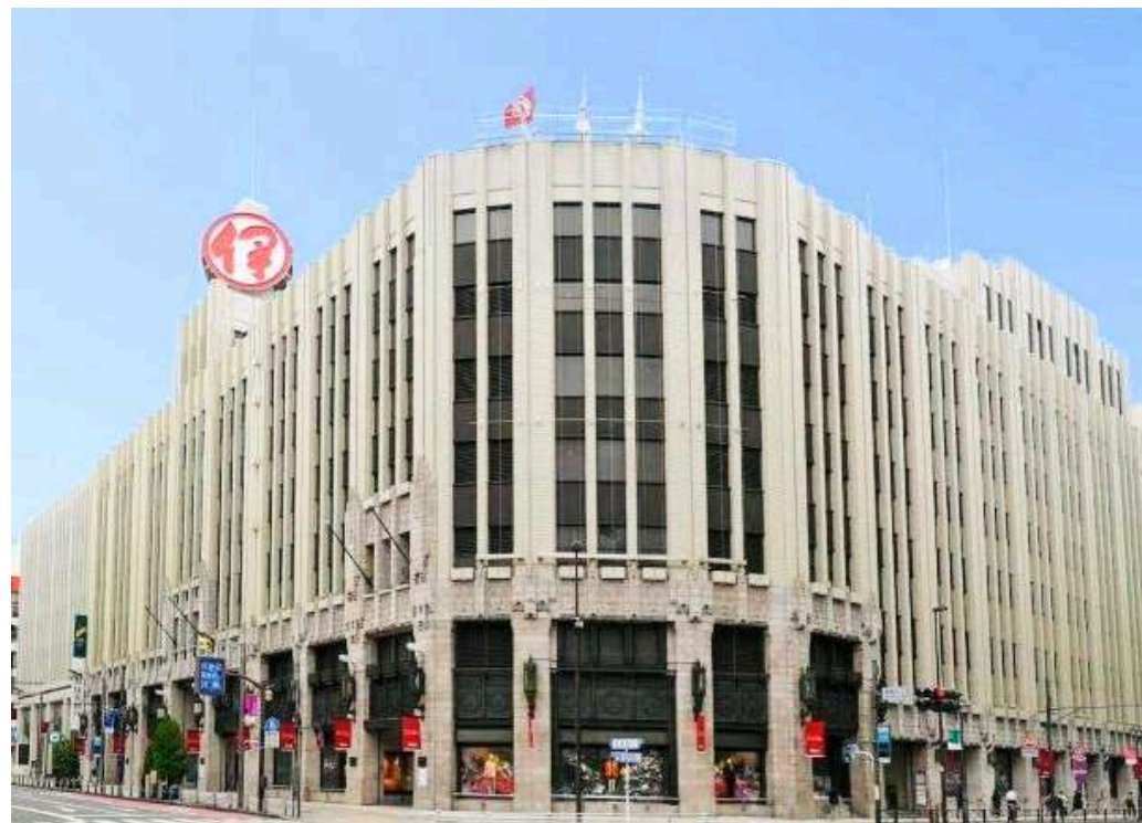
2024 ISETAN SHINJUKU EVENT&TALK SHOW