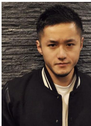
刈り上げスタイル！