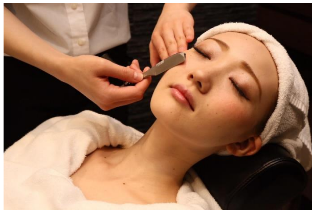
レディースシェービングも大人気メニューです！