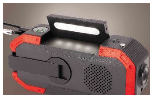
サブライト(20ルーメン)