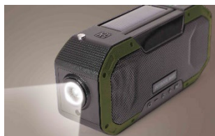
メインライト(95ルーメン)