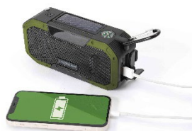
パワーバンク機能