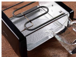
トレイで脂をキャッチ