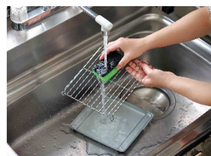
お手入れ簡単！網&トレイ