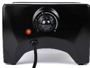
温度調節機能付き