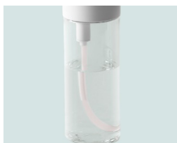
透明ボトルで残量が一目でわかる