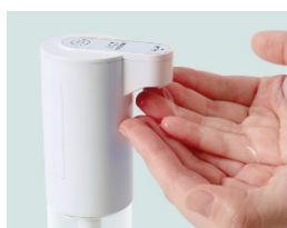
強・弱2モード搭載