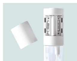
単4電池4本で使用可能