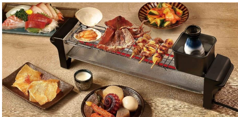
「にせんべろメーカー」（使用イメージ）

セット内容は、本体・焼き鳥網・おでん鍋・熱燗鍋・とつくり・おちょこ2つに加え、炙り網が大小2種類つき。ヒーターがロングなので、おでんと焼き鳥を同時に温めて楽しめるなど、贅沢に広々とお使いいただけます。コンセントにつなぐだけで、いつでもアツアツな酒のアテを味わえる『にせんべろメーカー』を使って、さらに充実した家飲みをお楽しみください。