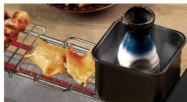
炙り網(小)&熱燗鍋+とつくり