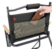
背面の収納ポケット