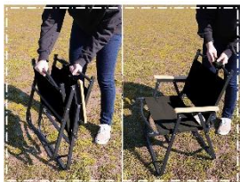
広げるだけの折りたたみ式