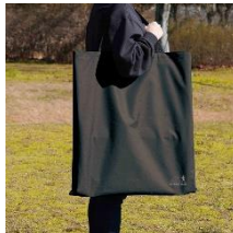
専用収納バッグ付属