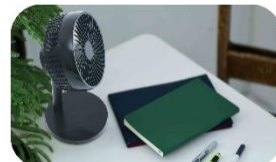
外回りから帰ってきた会社で