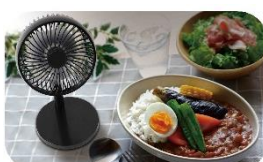
激辛カレーを食べる時に