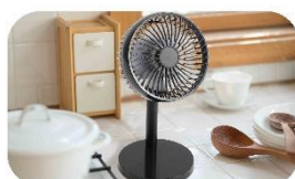
真夏のキッチンに