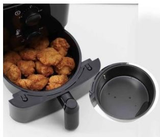
サクサク&ヘルシー