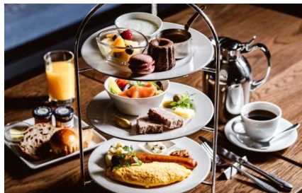
モーニングハイティー