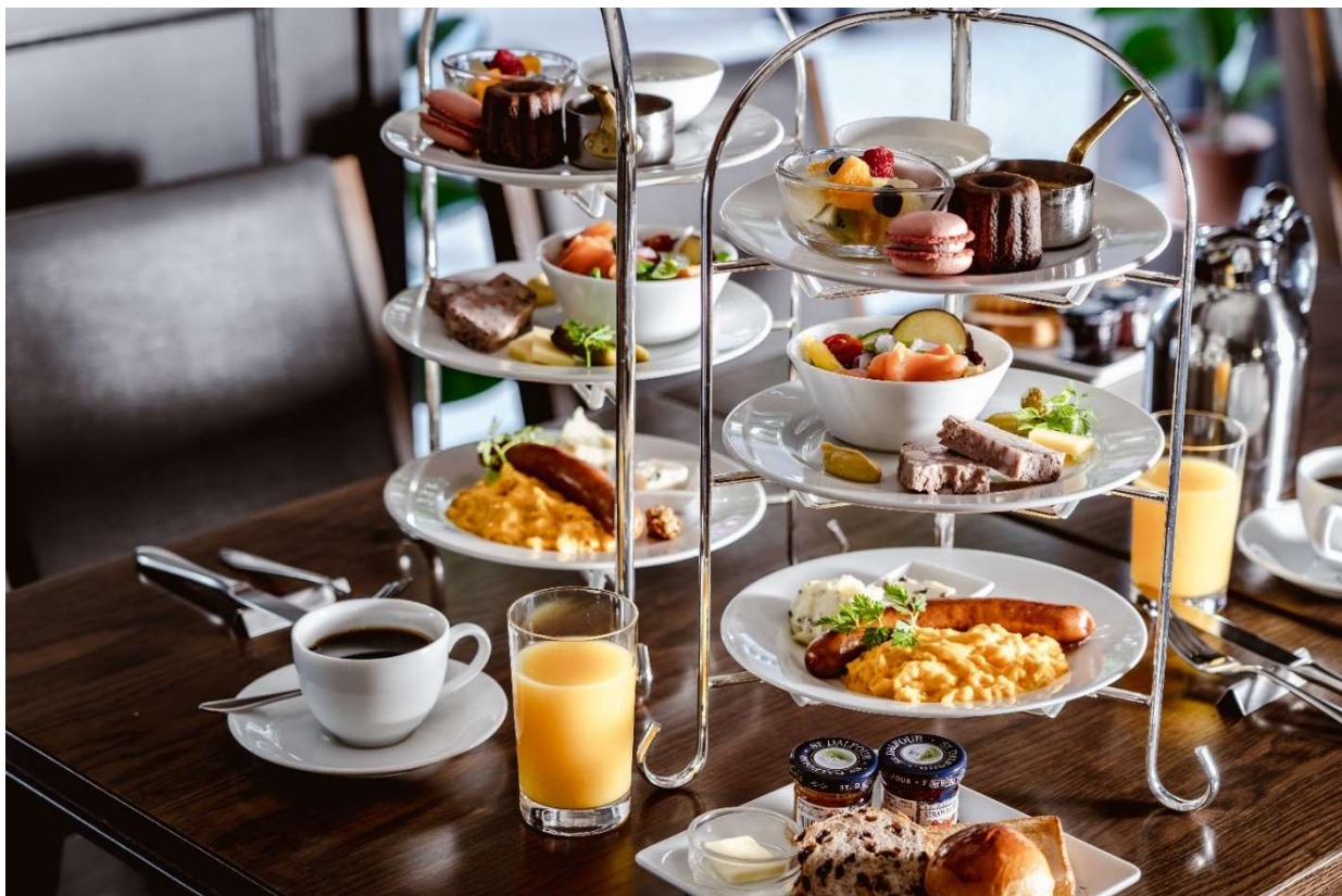
モーニングハイティー

ザ ロイヤルパークホテル 京都四条（所在地：京都市下京区烏丸通仏光寺上ル二帖半敷町668、総支配人：川口 泰宜）は、2022年1月24日（月）より、「【1日10食限定】モーニングハイティー付き宿泊プラン」を販売いたします。本プランでは、通常夕方から夜にかけて行われる食事を兼ねたお茶会であるハイティーを、今回初めて朝に楽しむ「モーニングハイティー」としてご用意いたします。日常の忙しさを忘れて、ホテルでゆったりとした優雅な朝のひとときを過ごしていただく宿泊プランです。