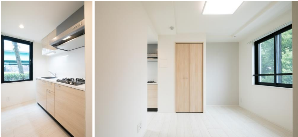
木目を基調とした内装

空間を自由に楽しんでもらえる”部屋づくりを意識し、全体的なデザインはシンプルな構成としています。