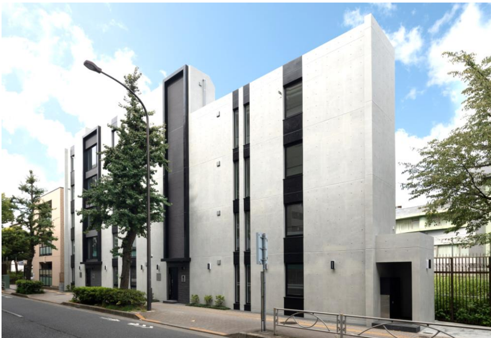
「NOZOMIO PREMIER 明大前」外観