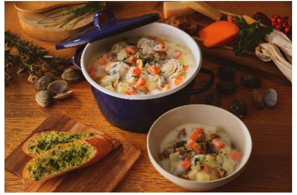
「クラムチャウダー マリブファームスタイル」 ¥1,200~