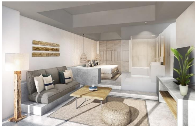
プライベート ヴィラ 50㎡/ガーデンテラス41㎡ 愛犬とも宿泊可能な「ドッグフレンドリールーム」