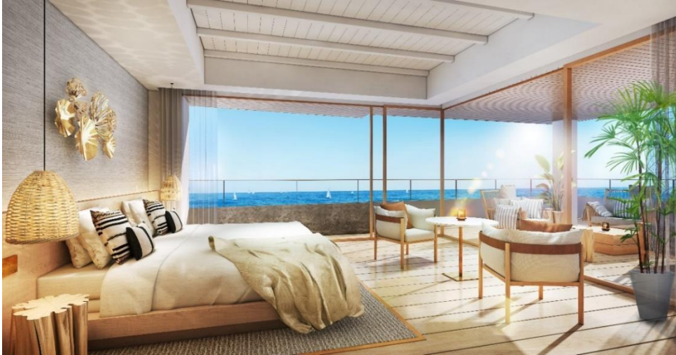
ザ マリブ スイート 93㎡/バルコニー51㎡

全11室が50㎡以上のオールスイートの客室は、全室から海を望む富士山ビューです。ロサンゼルスインテリアデザイナートップ20に選ばれる『ALEXANDER DESIGN (アレキサンダーデザイン)』のインテリア監修により、客室ごとに異なる眺望とスタイルの違う上質な空間は、テラスやバルコニーまで自由に使って寛げます。専用のアプローチやガーデンテラスを設えた『プライベート ヴィラ』では愛犬とも宿泊可能で、ペットも家族の一員という方々にも自由度の高いリゾートステイを叶えます。ルームサービスでは、マリブファームのお料理を客室へお届けする他、宿泊者のみお召し上がりいただける特別な日本料理のメニューを用意しており、お部屋に併設したガーデンテラスやバルコニーでもお召し上がりいただけます。また、災害時に電気自動車からホテルの照明やコンセントに電力が供給できるV2B (Vehicle to building) のシステムを導入した日本初のホテルとなり、エコロジーと防災にも配慮したホテルを目指しております。