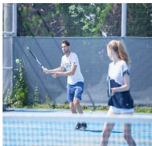
プライベートテニス

プライベートクルージング ：目の前のリビエラ逗子マリーナから出航し、江ノ島や葉山を海から散策したり、大型カタマランヨットのセーリングや船上からのサンセット鑑賞など、プランも多彩にご用意。