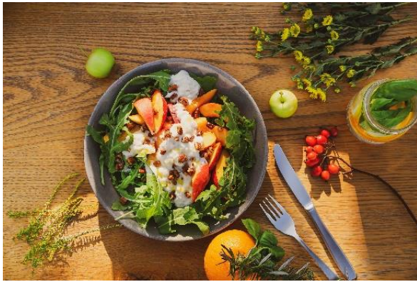
「ブラータチーズとフルーツのサラダ」 ¥1,800~

『マリブファーム』は、「フレッシュ、オーガニック、ローカル」がコンセプトのレストランです。オーナーシェフのヘレン・ヘンダーソンさんが提供する料理は、厳選した素材の美味しさが際立ち身体にも優しいと評判で、海外セレブをはじめ、地元の住民のみならず観光客にも人気を博し、アメリカに展開する6店舗では長蛇の列が出来るほどです。リビエラ逗子マリーナ内の『マリブファーム』では、現地のレシピを軸に、地元鎌倉の新鮮野菜や相模湾の魚介類を使用した、日本限定メニューも登場します。現地でも人気の「ブラータチーズとフルーツのサラダ」や、日本限定のスペシャルレシピ「クラムチャウダー マリブファームスタイル」を是非お試しください。