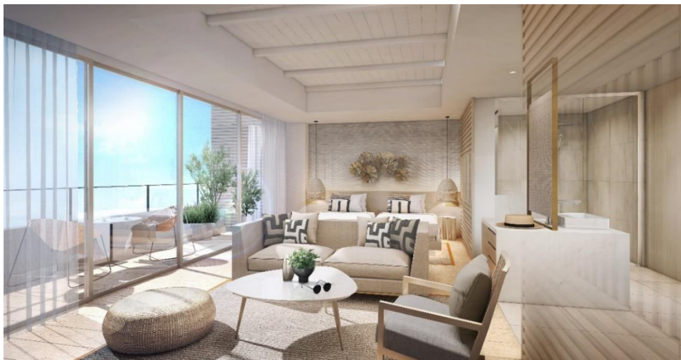
マリーナ ビュー スイート 50㎡/バルコニー7㎡