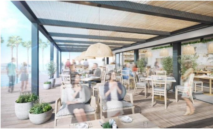
マリブファーム (テラスイメージ)

セレブのビーチハウスが建ち並ぶ L.A.屈指の景勝地マリブ。その象徴であるマリブピアに佇み、絶大なる人気を誇るレストランが日本初上陸で、このリビエラ逗子マリーナにグランドオープンします。