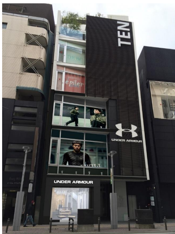
店舗外装イメージ

http://www.underarmour.co.jp/uach/fukuoka-tenjin.php