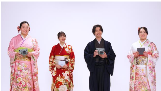
インタビューの様子