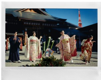
4人での記念写真のチェキプリント™

特設 WEB サイトでは、TVCM に登場する広瀬すずさん、横浜流星さん、北口榛花選手、竹田麗央選手を写した「ワイドフォーマット」のチェキプリント™や、「ワイドフォーマットフィルム」に対応した「instax WIDE 400™」と「instax Link WIDE™」を紹介しています。