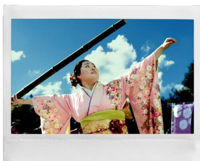
北口榛花選手のチェキプリント™