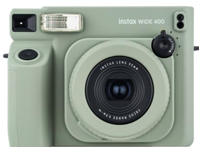
instax WIDE 400™

※3 「Instagram」は、Instagram,LLC の商標または登録商標です。