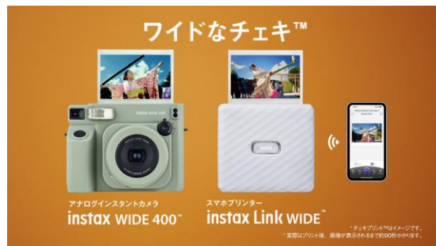
ワイドフォーマットフィルムに対応した製品

* チェキプリント™はイメージです。 * 実際はプリント後、画像が表示されるまで約90秒かかります。