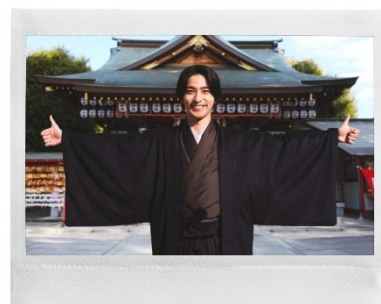
横浜流星さんのチェキプリント™