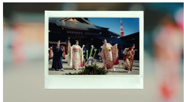
TVCM「お正月を写そう♪2025 チェキ™・ワイドな活躍」篇のカット