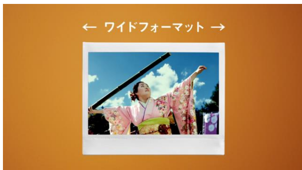
ワイドフォーマットのチェキプリント™

「instax Link WIDE™」は、専用アプリ※1とBluetooth※2接続することで、スマホの中のお気に入りの画像を高画質なチェキプリント™にしてお楽しみいただけます。