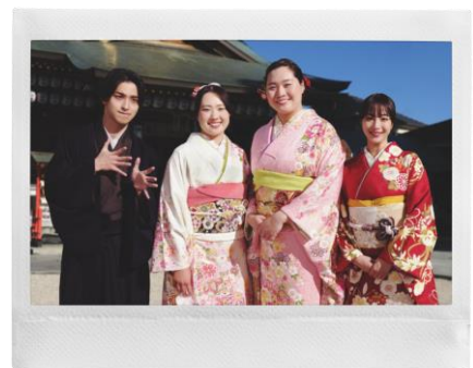
4人のチェキプリント™