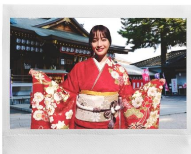
広瀬すずさんのチェキプリント™