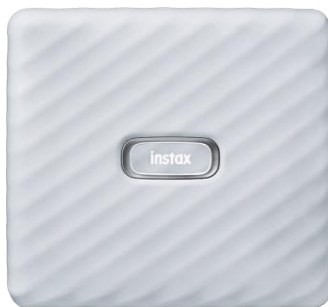
instax Link WIDE™