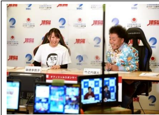
大会の様子は、鹿児島(MBC 南日本放送)を拠点に全国へ配信