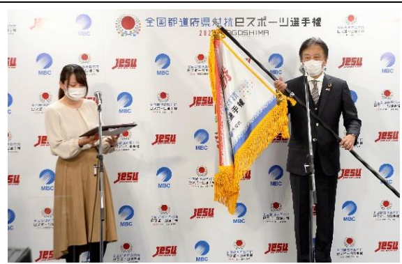
総合優勝セレモニーの様様。 総合優勝旗は、日本eスポーツ連合・ 岡村秀樹会長より大阪府へ

実施した5競技の予選参加者の合計は、昨年の15,000人を大きく上回る83,000人となり、地方予選を勝ち抜いた125名の選手が参加しました。コロナ禍の影響により、当初の開催スケジュールの変更を余儀なくされた鹿児島大会ですが、鹿児島を拠点に全国eスポーツ選手をオンラインで繋ぎ、熱い戦いを繰り上げました。