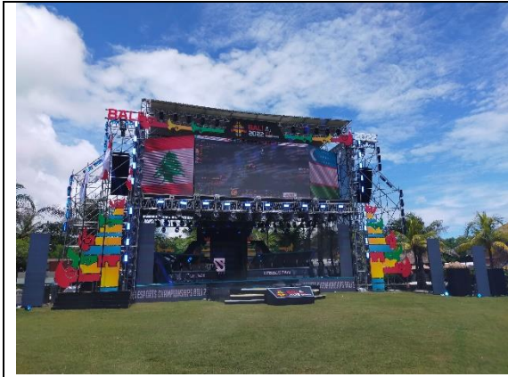
バリ島のリゾートホテル・Merusaka Nusa Duaに、全世界のeスポーツ選手が集結。