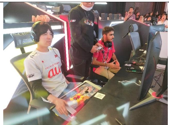
グループリーグでリビア代表と戦う日本代表のダブル選手 (Tekken 7)