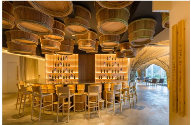
TARU Bar the Hokkaido