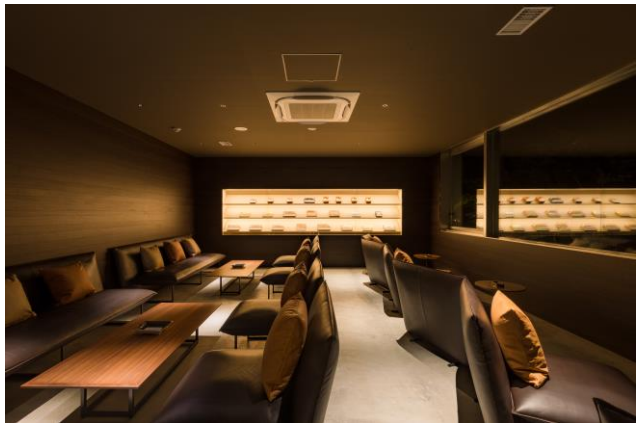
The Cigar Bar