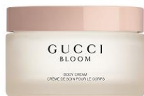
グッチ ブルーム ボディクリーム 180ml 8,500円(消費税別)