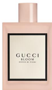
グッチ ブルーム ゴッチェ ディ フィオーリ オードトワレ 100mL 13,500円(消費税別)