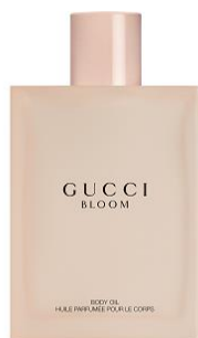
グッチ ブルーム ボディオイル 100ml 7,000円(消費税別)