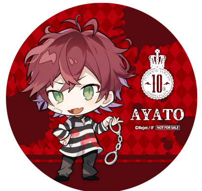
オリジナルコースター