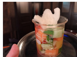
ビーカーピクルス