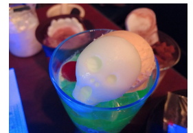
スクリームソーダ