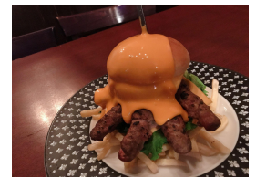
数量限定！ モンスターバーガー