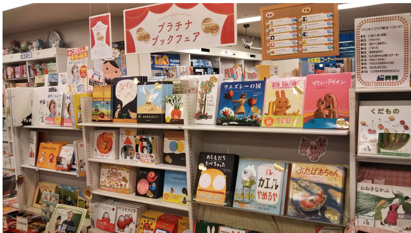
八重洲ブックセンター本店様での展開イメージ