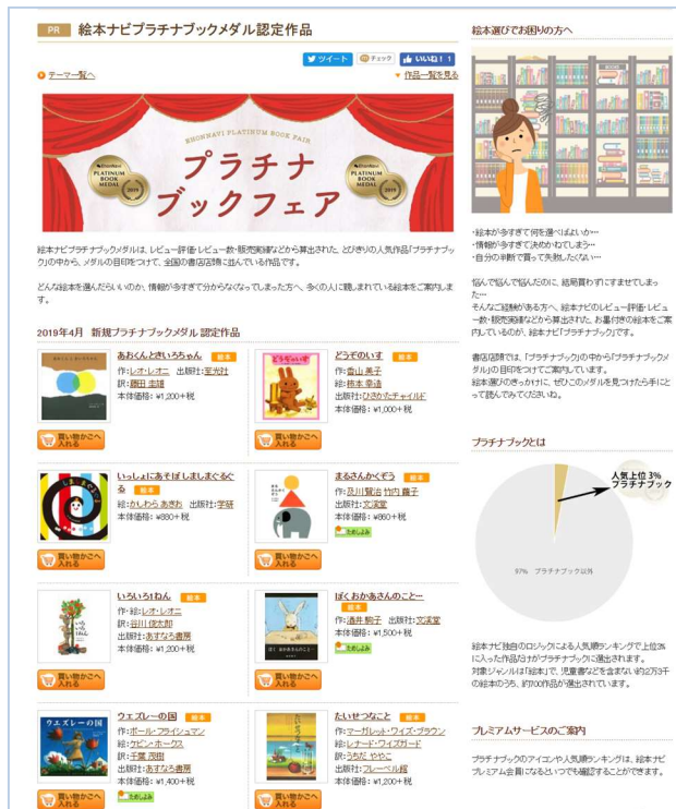
絵本ナビサイト上での展開イメージ

>> 絵本ナビ プラチナブックコーナーはこちらから https://www.ehonnavi.net/special.asp?n=4134