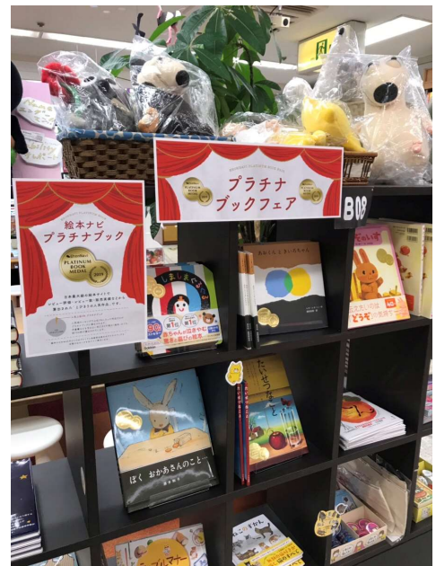
紀伊國屋書店新宿本店様での展開イメージ